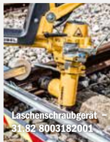
Laschenschraubgerät – 31.82 8003182001

8003182001 Laschenschraubgerät 31.82 zum Lösen und Befestigen von Laschenschrauben