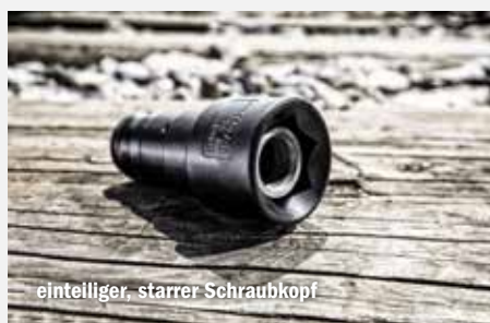
einteiliger, starrer Schraubkopf