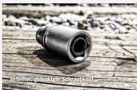
geteilter, gelenkiger Schraubkopf