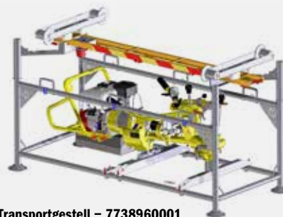
Transportgestell – 7738960001

7738960001 Transportgestell (stapelbar) universell einstellbar für ROBEL Schraubmaschinen vom Typ 30.73, 30.82RKS, 30.83, 34.01