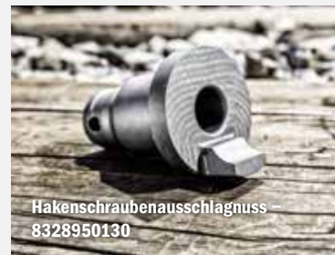
Hakenschraubenausschlagnuss – 8328950130

8328950130 Hakenschraubenausschlagnuss für K-Oberbau