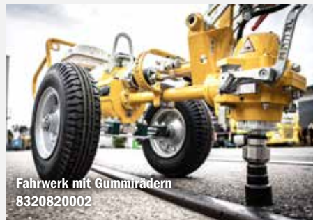
Fahrwerk mit Gummirädern 8320820002

8320820002 Fahrwerk mit Gummirädern für Arbeiten in Bereichen mit fester Fahrbahn