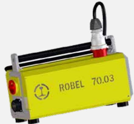
Netzteil 400 Volt – 5039900003