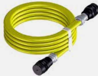
Verbindungskabel – 5016060210