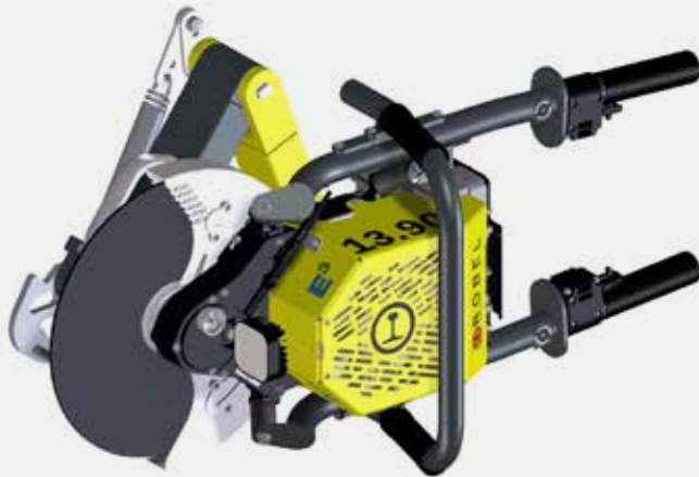
ROCUT 13.90 – 5909900008