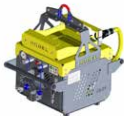
BLDC-Antriebseinheit E 3