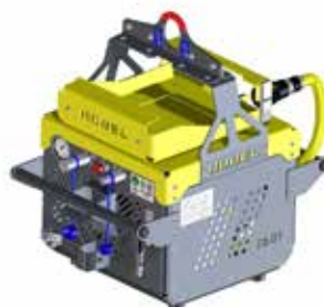
BLDC-Antriebseinheit E 3