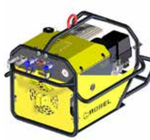
Honda GX 270 Antriebseinheit