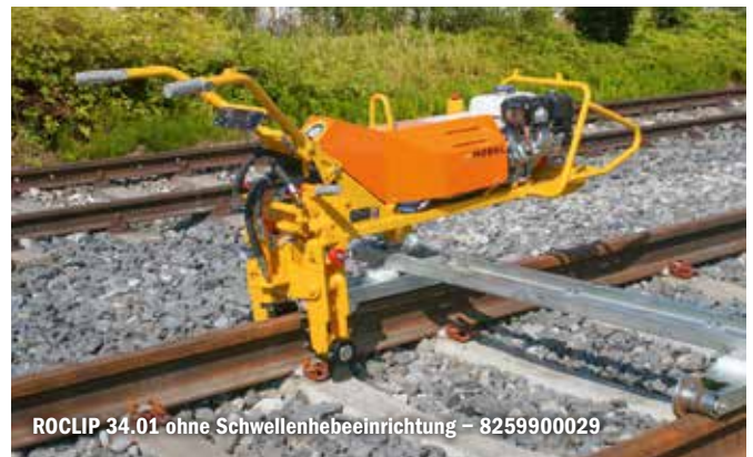
ROCLIP 34.01 ohne Schwellenhebeeinrichtung – 8259900029