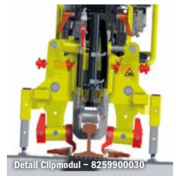
Detail Clipmodul – 8259900030