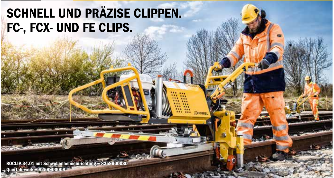
ROCLIP 34.01 mit Schwellenhebeeinrichtung – 8259900030 Querfahrwerk – 8259900008

Zum Ein- und Ausdrücken von Fastclip Befestigungsbügel in Neubau und Instandhaltung.